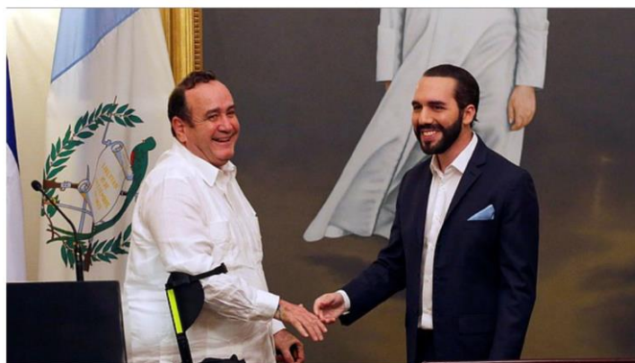
SAN SALVADOR. La propuesta de cielos abiertos data de 1996, pero recién comienza a concretarse en dos países de Centroamérica.

Guatemala plantea a El Salvador tener un puerto con salida al océano Atlántico y permitir el libre tránsito de mercancías