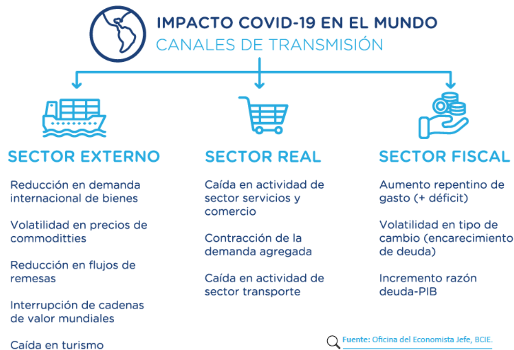
INFOGRAMA 1. Dinámica de la transmisión en la economía mundial