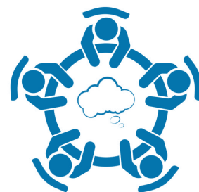
Table Topic 2 (Moderated by Adrian Hoefler, United States):