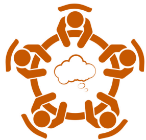
Table Topic 5:

The Role of Training in the Empowerment of Women in Aviation