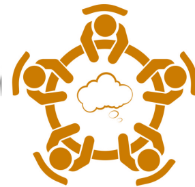
Table Topic 4:

Regional Standardization and Harmonization of Training Programmes by Area