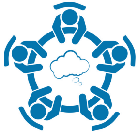
Table Topic 2:

Regional Availability of Qualified Instructors