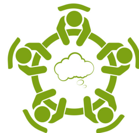
Table Topic 3:

Alignment of National and Regional Training Needs