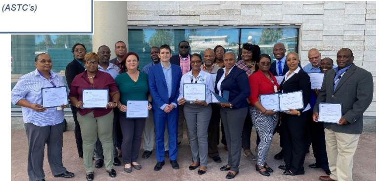
Taller NCASP Bahamas, Febrero 2024

Certificación de Instructoras AVSEC de la OACI CIASA, Ciudad de México, noviembre de 2023