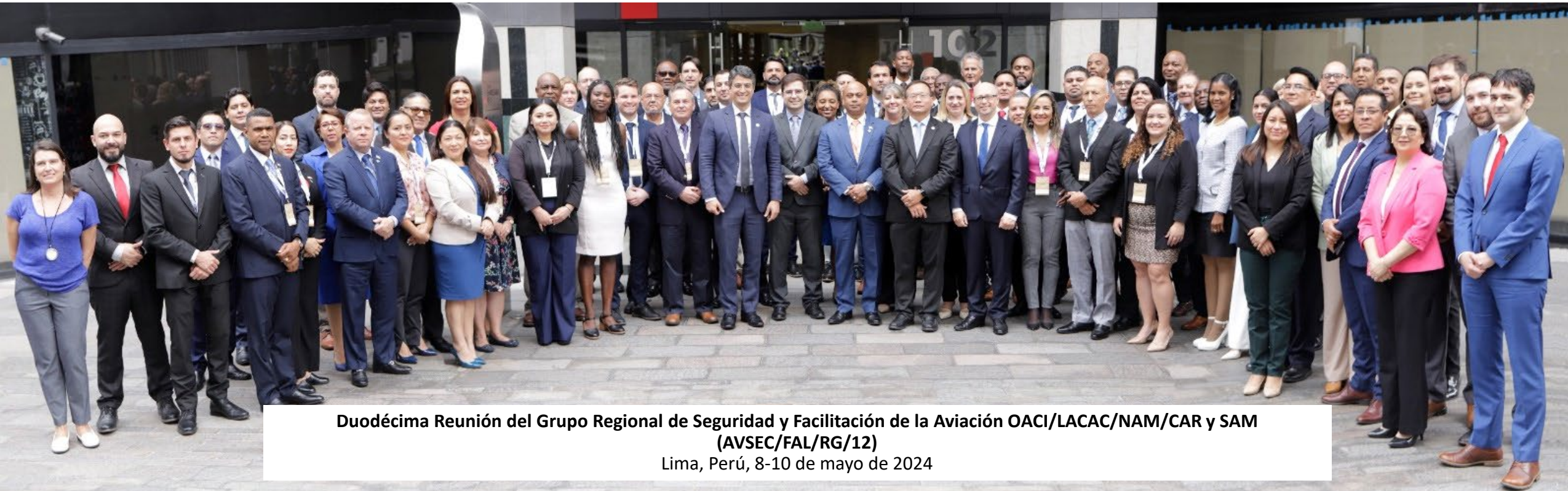
Duodécima Reunión del Grupo Regional de Seguridad y Facilitación de la Aviación OACI/LACAC/NAM/CAR y SAM (AVSEC/FAL/RG/12)